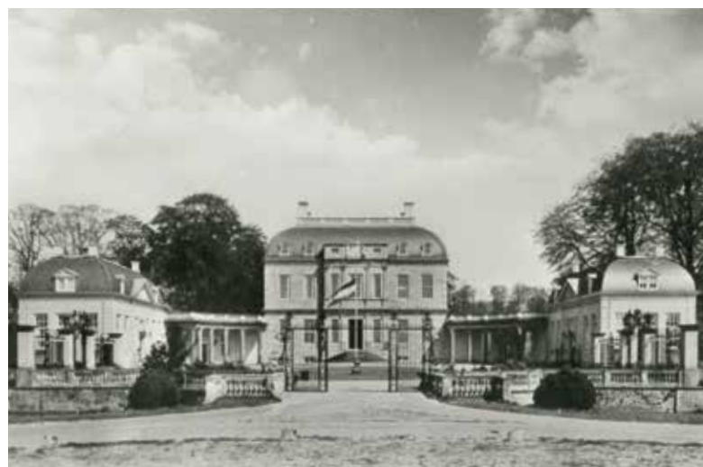
Het derde (praktijk)jaar begon met negen weken op het opleidingscentrum van de toenmalige Heidemij: Huis De Voorst in Eefde.