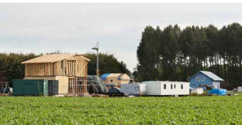
De achterburen bouwen zelf een huis van strobalen, oktober 2018.

onder meer om de verharding te compenseren. Deze warme zomer was het ook een fijne zwembijver.' De taluds zijn ingezaaid met speciaal oeverzaad. Laat nu de biodiversiteit maar komen! De grond die bij het graven is vrijgekomen ligt op een flinke bult. Wiebren: 'Die moeten we nog verwerken. Voor elk perceel geldt een gesloten grondbalans.'