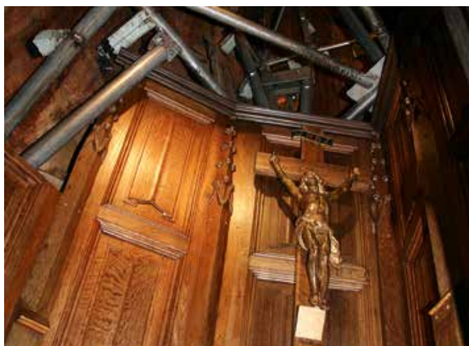
De staalconstructie in de Jezus-eik.

De tweede dag staat grotendeels in het teken van de Tweede Wereldoorlog. In