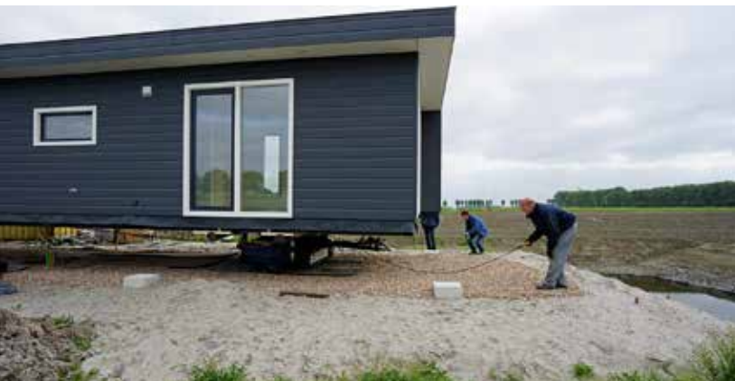
Het huis wordt geplaatst, mei 2017.