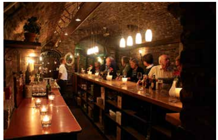
Bijpraten bij de bar.