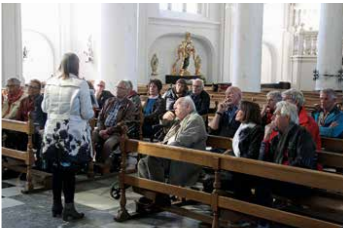
Aandachtig luisteren naar de gids.