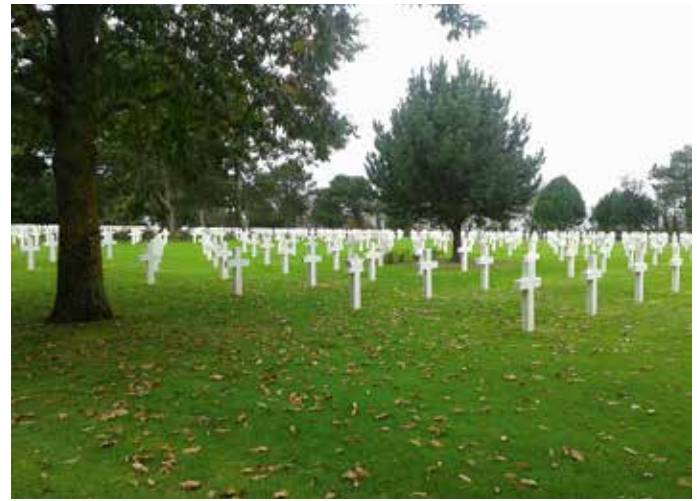
Amerikaanse begraafplaats in Colleville-sur-Mer.

Arromanches-les-Bains beginnen we met een indringende 360°-film over de invasie. Dit is ook de plaats waar de geallieerden een Mulberryhaven bouwden om de oorlog te beslechten: een indrukwekkend staaltje bouwkunst en samenwerking.