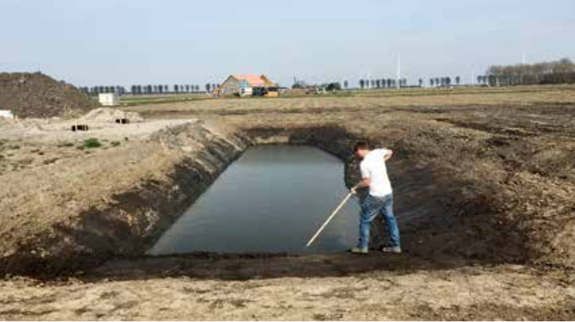
Aanleg van de waterberging.