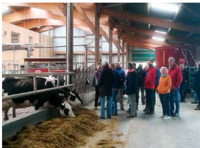
Een kijkje in de stal van familie de Haan.