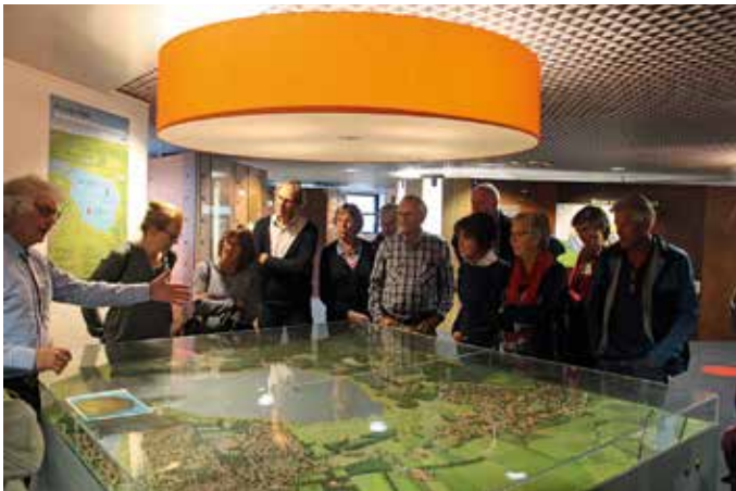
Uitleg bij de maquette van WPH in het infocentrum.