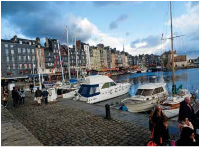
Le vieux bassin van Honfleur.