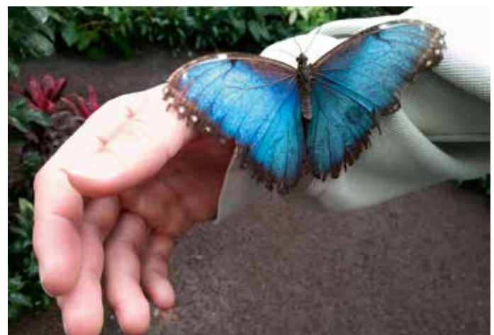
Vrouwetje van de Morpho anaxibia (vleugels van het mannetje zijn helemaal blauw).

een storm aanspoelde voor de kust van Brazilië. De naam-bordjes bij de planten zorgen voor een déjà vu. De gedachten gaan terug naar de lessen planten kennis op Larenstein. De beperkte omvang van de vlindertuin geeft daarnaast te denken dat zoiets ook bij particulieren te realiseren moet zijn. Een niche voor T&L'ers? Dan is er tijd om de stad te ontdekken. Een aantal mensen bezoekt de Sainte-Catherine, de grootste houten kerk van Frankrijk, of shopt bij de chocolatier of patissier . Al lopend valt het grote aantal galeries op. De stad is trots op de kunstenaars die ze in de loop der jaren heeft voortgebracht