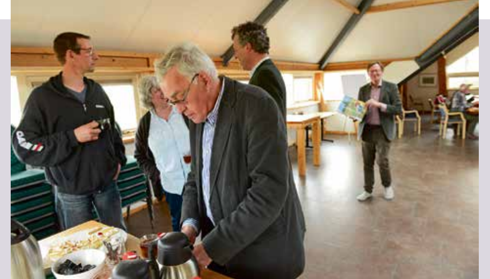
Bijeenkomst van BB4Food op de Eemlandhoeve.

Hij constateert bij landgoedeigenaren wat koudwatervrees. 'Er wordt snel gedacht dat het duur is om mij in te schakelen. Maar ik ga eerst vrijblijvend het gesprek aan. Bovendien hebben veel landgoederen langjarige contracten met rentmeesterskantoren. Als eenpitter kom je niet makkelijk binnen. Maar ondertussen ben ik wel twee jaar geleden met de herbestemming van Paleis Soestdijk bezig geweest, als een van de vier uit 120 kandidaten!' Zijn inzet voor landgoederen wordt opgemerkt. Eerder vroeg het Gelders Particulier Grondbezit hem voor het bestuur en momenteel verricht hij projectwerk voor de landelijke Federatie Particulier Grond-