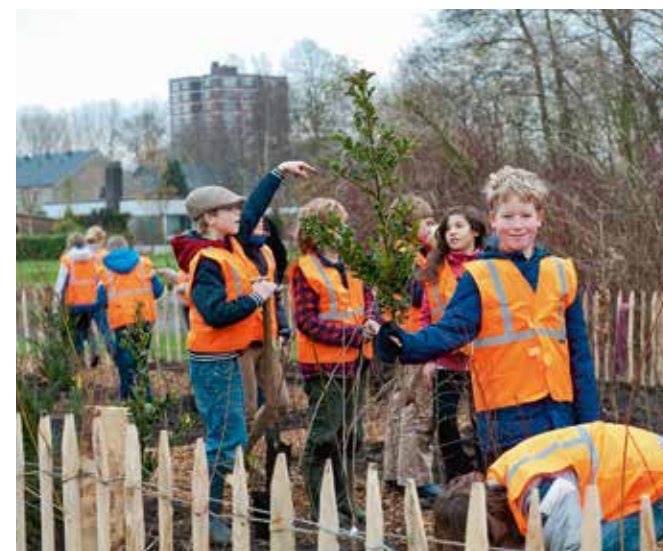
Het Tiny Forest dat IVN in Rheden gaat maken, is een mooi studie- en leerobject voor hogeschool Van Hall Larenstein en Helicon MBO Velp.

TEKST RIA DUBBELDAM