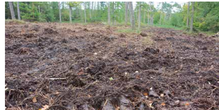
Intensief bewerkte bosbodem.