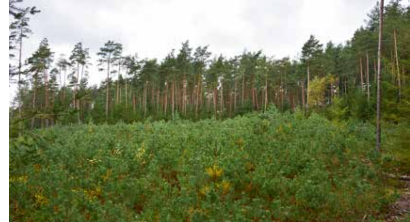
Zo zien de nieuwe bossen na kaalkap er uit. Cultuurgedwongen.